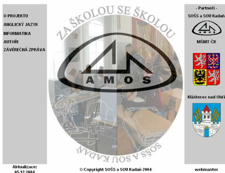
Obr. 2 Úvodní strana internetové aplikace