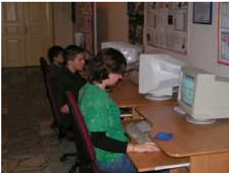
Obr.1 Studenti při samostatné práci na studentském pracovišti

Podrobné finanční vyhodnocení se nachází v příloze 3.